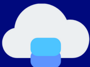
captação de leads

disponha de servidores robustos e seguros para captação de leads, dentro da LGPD e GPRS.